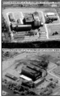
Pre-Strike – Post-Strike: Der hygienisierte Präzisionskrieg der NATO

Hinter all diesen konkreten Vermittlungsstrategien scheint ein Kriegsdiskurs auf, der weit mehr beinhaltet als die reine Frage nach einer adäquaten Reaktion auf die Verletzung von Menschenrechten. Vielmehr konstituiert sich innerhalb dieses Diskurses eine Vorstellung des ›westlichen Subjekts‹, das sich scheinbar für alle sichtbar als ›zivilisiert‹ (z.B. in Abgrenzung zur ›serbischen Barbarei‹) in der Wahl der Mittel erweist, das Krieg zwar ablehnt, militärische Gewalt unter einer (permanent expandierenden) Reihe von Ausnahmen jedoch legitimiert sieht, was sich wiederum auf der vermuteten eigenen zivilisatorisch (-technologischen) Überlegenheit gründet, diese gleichzeitig begründend.