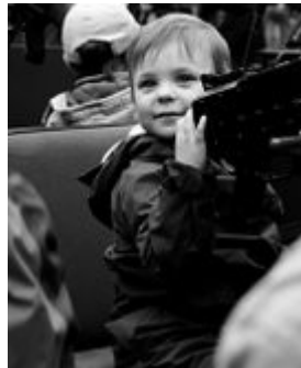
Eine MG als Kinderspielzeug: Das ganz alltägliche Rauschen des Krieges