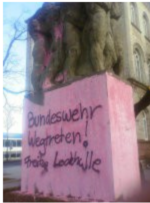
Kriegsdenkmäler und Blasmusikparaden umgestaltet

Vielmehr wird durch die symbolische Rückbindung des Militärischen an vermeintlich ganz andere Diskurse wie die von gender oder musikalischer Ästhetik die traditionalisierte und diskursiv abgesicherte Wirkung der Bilder vom Krieg und vom Frieden unterbrochen, und damit das Subjekt der Neuen Heimatfront in seiner vermeintlichen Teilnahmslosigkeit am realen Kriegsgeschehen vielleicht aufgestört. Dort, wo das Militärische nicht mehr alltäglich dem Bereich des Friedens zugeschlagen werden kann, sondern konkret und über die sinnliche Wahrnehmung auf Krieg und Tod und Zerstörung verweist, wird das Militärische möglicherweise ungenießbar. Das Lokalisieren des westlichen Selbst im Umfeld des Krieges vermag den ungestörten Lustgewinn, den sein gefahrloser Konsum des vom Krieg bereinigten Militainment bereitet, nicht nur zu thematisieren, sondern damit auch aufzustören.