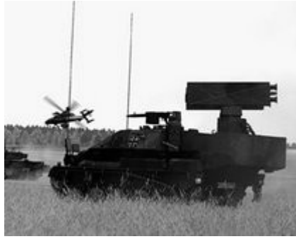
Computerspiel "Armed Assault"