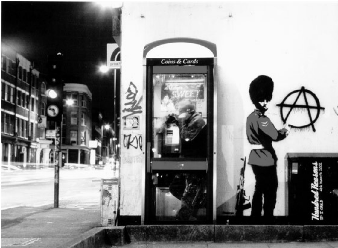
Krieg im Alltag: Graffito von Banksy

Vielmehr wird durch die symbolische Rückbindung des Militärischen an vermeintlich ganz andere Diskurse wie die von gender oder musikalischer Ästhetik die traditionalisierte und diskursiv abgesicherte Wirkung der Bilder vom Krieg und vom Frieden unterbrochen, und damit das Subjekt der Neuen Heimatfront in seiner vermeintlichen Teilnahmslosigkeit am realen Kriegsgeschehen vielleicht aufgestört. Dort, wo das Militärische nicht mehr alltäglich dem Bereich des Friedens zugeschlagen werden kann, sondern konkret und über die sinnliche Wahrnehmung auf Krieg und Tod und Zerstörung verweist, wird das Militärische möglicherweise ungenießbar. Das Lokalisieren des westlichen Selbst im Umfeld des Krieges vermag den ungestörten Lustgewinn, den sein gefahrloser Konsum des vom Krieg bereinigten Militainment bereitet, nicht nur zu thematisieren, sondern damit auch aufzustören.