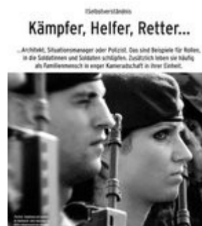
Gender-Neutralität im Kampfeinsatz: Der Krieg ist weiblich geworden, die Krieger bleiben männlich