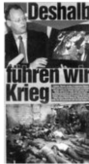
PR des Krieges: Bildtechniken und das Leid der Anderen

Wenngleich es noch sieben Jahre bis zum eigentlichen Kriegseintritt der NATO-Staaten dauern sollte, begleiteten derartige Bilder die gesamte Vorbereitungsphase. So betitelte die Bild-Zeitung 1999 z.B. das Foto eines Flüchtlingsstroms mit »Sie treiben sie ins KZ«. Mit den Fotos eines vermeintlichen Massakers an Zivilisten in der Ortschaft Rugovo präsentierte der damalige Verteidigungsminister Rudolf Scharping kurz darauf eben solche Gräuelbilder zur Kriegslegitimation, obwohl internationale OSZE-Beobachter zu jenem Zeitpunkt bereits bestätigt hatten, daß es sich bei den Toten um kosovoalbanische UÇK-Soldaten handelte.